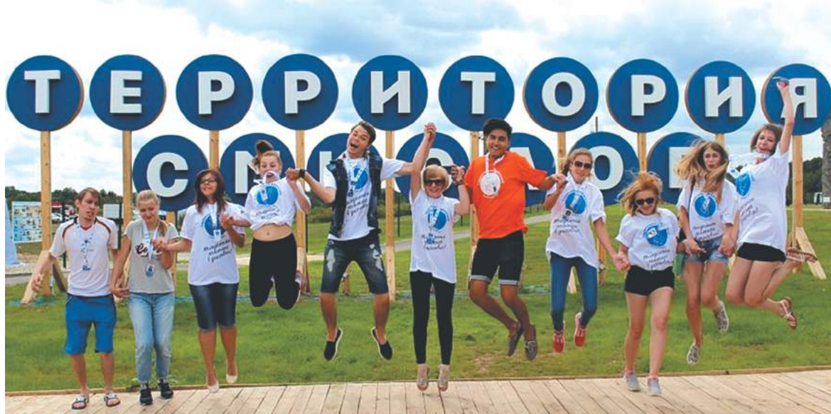
На форуме собрались активные и талантливые молодые люди со всей страны.

Студенты СамГТУ побывали на форуме «Территория смыслов на Клязьме»