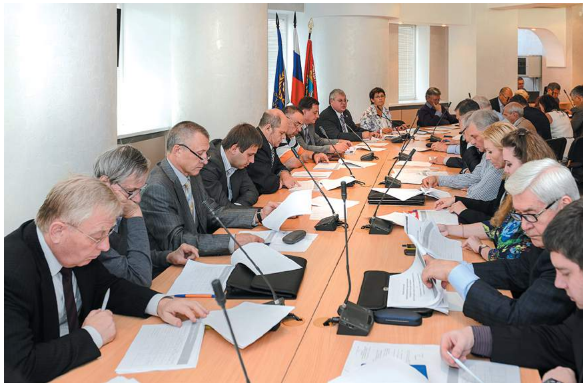
Члены Учёного совета ознакомились с показателями деятельности вузов.

Учёный совет СамГТУ высказался за объединение со СГАСУ